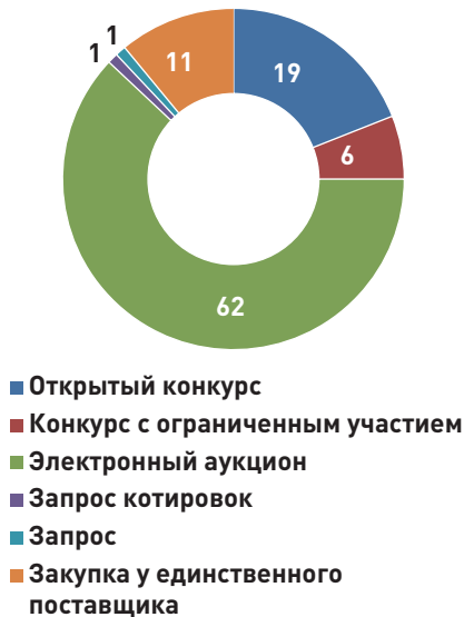
Рисунок 1. Объявленные закупки в рамках Закона № 44-ФЗ, в I—III кварталах 2014 г., %