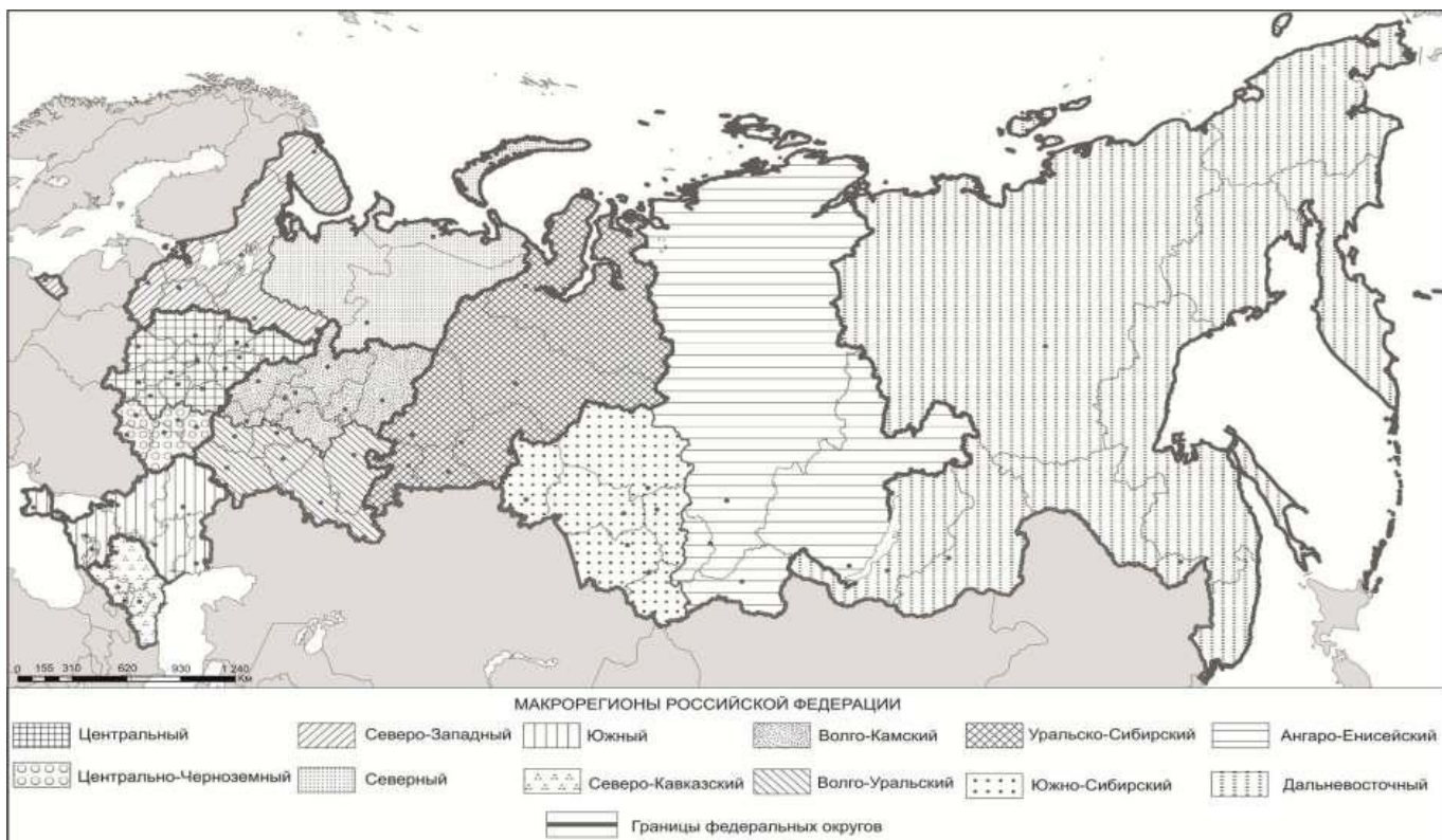
Схема размещения макрорегионов Российской Федерации

Приложение N 3 к Стратегии пространственного развития Российской Федерации на период до 2025 года